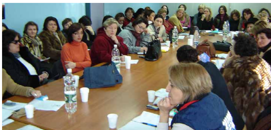
Anëtares e RRGGK-së në takimin e tyre të fundit koordinues.

Takimi i përdymuajshëm i RRGGK.....HCIC, 6 qershor, ora 11:00