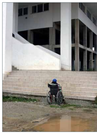
Duke pritur para shkallëve të ndërtesës komunale në Deçan - në Kosovë përafërsisht 140,000 persona me aftësi të kufizuara fizike ballafaqohen me pengesa në realizimin e të drejtave themelore njerëzore.

Fondi për Iniciativë Demokratike e ka financuar këtë projekt përmes Projektit të Avokimit të OJQ-vë të Kosovës, që përkrahët nga East-West Management Institute dhe nga populli amerikan përmes USAID-it.