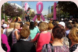
Qindra persona janë mbledhur për të ngritur vetëdijen lidhur me kancerin në gji, duke kërkuar veprime institucionale.

Qendra Kosovare për Luftimin e Kancerit të Gjirit 'Jeta/Vita' organizoi një 'Ecje për shërim' në Prishtinë më 5 tetor. Në këtë marsh morën pjesë mysafire të shquara, përfshirë deputeten e Parlamentit Evropian dhe raportuesen për Kosovën dhe ambasadorë të ndryshëm në Kosovë. Qindra qytetarë morën pjesë në këtë ngjarje, për të dëshmuar solidaritet me të mbijetuarat e kancerit të gjirit. Kjo ecje ka pasur për qëllim shtimin e nivelit të vetëdijes mes grave dhe në shoqëri sa i përket kancerit të gjirit, që besohet se është duke shënuar shtim në Kosovë, ku mundësitë për zbulim të hershëm dhe trajtim janë të limituara. Në të njëjtën ditë ato lansuan një peticion të lansuar nga Qendra e Grave Prehja në Skenderaj, me të cilën kërkohet shfrytëzimi i pajisjeve të rrezatimit që kanë mbetur në bodrum të Institutit të Onkologjisë. Anëtarët e RRGK-së po vazhdojnë të grumbullojnë nënshkrime nëpër komunitetet e tyre, ndërsa peticioni mund të nënshkruhet edhe duke kontaktuar RRGK-në në adresën