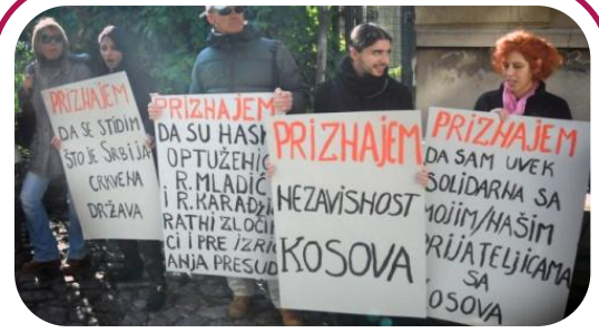
Gratë në të Zeza në Serbi mbështesin kërkesat e kosovarëve për drejtësi gjatë protestës së tyre në Beograd në nëntor.