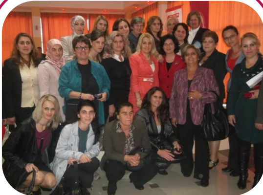
Vizita e frave parlamentare me Grupet e Avokimit të Barazisë Gjinore nga Dragashi, Mamusha dhe Prizreni, shkëmbimi i përvojave dhe strategjia për të çuar përpara të drejtat e grave.

GABGj i kanë ofruar grave në politikë përkrahje nga gratë tjera në politikë dhe nga shoqëria civile nga komunat e tyre, si dhe nga GABGj në komunat tjera. Si rezultat i kësaj, gratë tash nuk ndihen të vetmuara kur ballafaqohen me diskriminimin gjinor brenda partive të tyre dhe/ose gjatë vendim-marrjes në komuna.