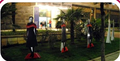
Siluetat e grave të rëndësishme të histories së Shqipërisë qëndrojnë para muzeut në Tiranë.

Pas konferencës, pjesëmarrëset morën pjesë në ekspozitën "100 vjet të jetës dhe kontributeve të grave në Shqipëri." Siluetat e grave të rëndësishme për historinë e Shqipërisë qëndronin në hyrjen e muzeut në Tiranë. Hulumtimet në arkivat e historisë u morën parasysh në këtë përzgjedhje. 100 vjetori i Shqipërisë dhe aktivizmi 20 vjetor i grave në Shqipëri u shënuan me orë letrare, panele diskutimesh dhe shfaqje të dokumentarëve, "Gratë bëjnë historinë" në disa stacione televizive në Shqipëri. Aktivitetet u përmbyllën me një edicion komplet që shënon figurat më të rëndësishme të grave, të titulluar, "90 + 20, Lëvizja e grave në Shqipëri – Rruga përpara."