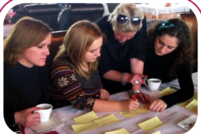
Anëtarët e RrGGK marrin pjesë në një punëtori interaktive dy ditore mbi shkrimin e projekt propozimit.