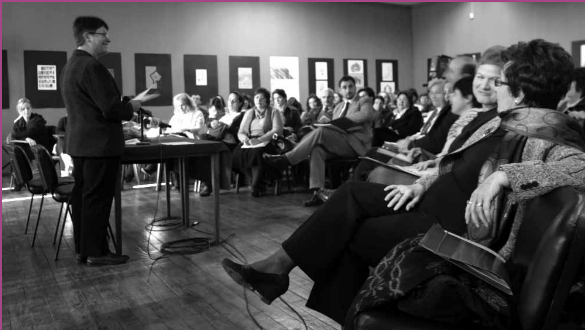
Mbledhja Vjetore e Rrjetit të Grupeve të Grave të Kosovës, Dhjetor 2006, Prishtinë.

Rrjetëzimi na ka dhënë fuqi. Përmes rrjetëzimit organizatat tona anëtare kanë gjetur përkrahje morale dhe solidaritet, që i ka fuqizuar ato në vazhdimin e ofrimit të shërbimeve me qëllim të arritjes deri tek ndryshimet në komunitetet e tyre. Përmes rrjetit, ato janë bashkuar në koalicione të cilat punojnë për të ushtruar ndikim në politikat publike lidhur me barazinë gjinore, të drejtat riprodutive të grave, dhunën familjare, dhe trafikimin me qenie njerëzore. Përmes rrjetëzimeve me aktiviste dhe organizata të grave nga rajoni, ne kemi bërë që zëri i gruas të dëgjohej në negociatat mbi statusin final të Kosovës. Rrjetëzimi në rajon gjithashtu na ka shtyrë që të sfidojmë politikat donatore me të cilat ne nuk pajtohemi dhe/ose të cilat nuk ndihmojnë që të bëjmë ndryshime në komunitetet tona. Në fakt, ne besojmë se rrjetëzimi na ka dhënë fuqi që të bëjmë që zëri ynë të dëgjohej. Rrjedhimisht, ne kemi punuar drejt fuqizimit të mëtejshëm të anëtareve dhe punonjësve tanë, në mënyrë që kjo të pasqyrohet në fuqizimin tonë si rrjet.