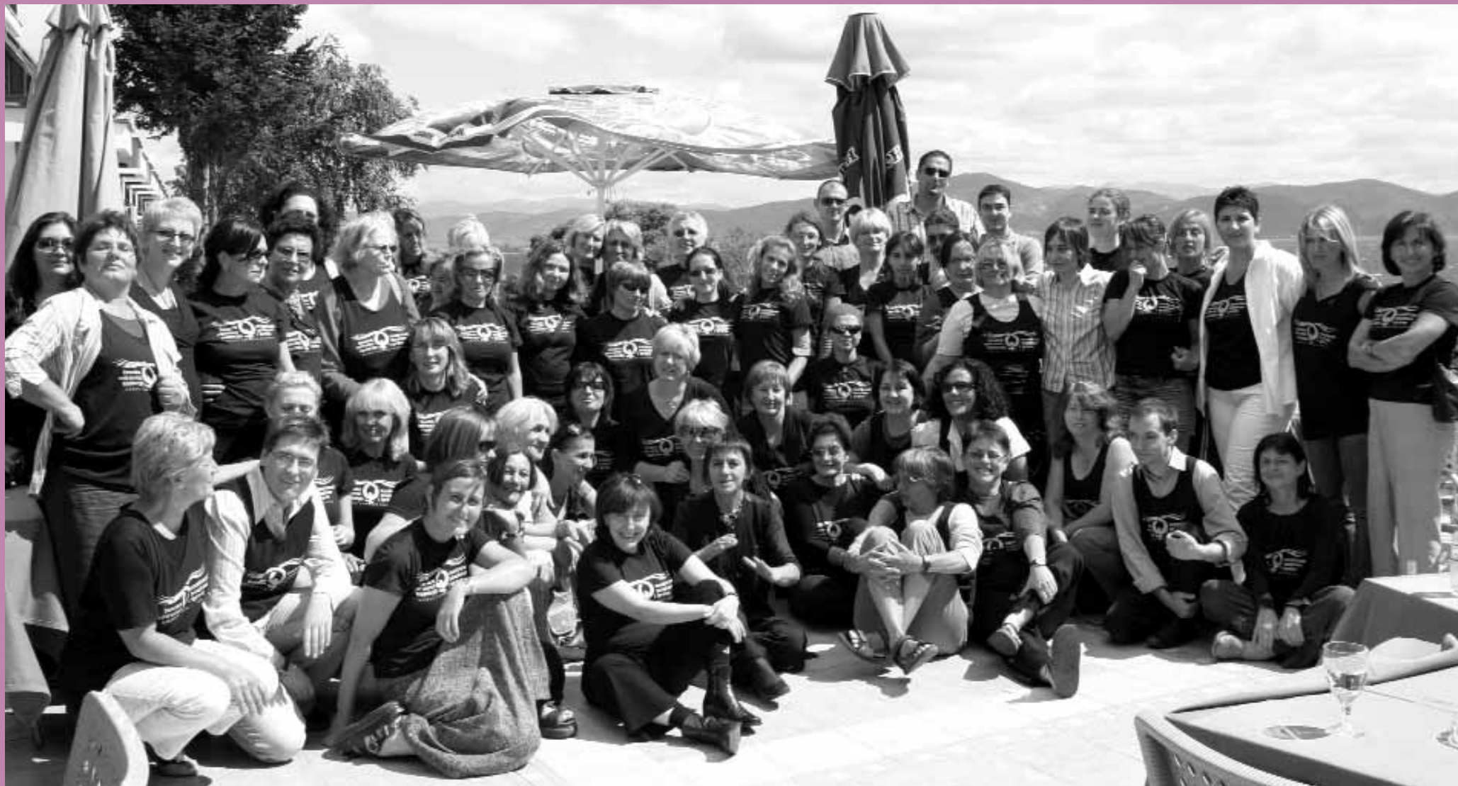
Konferenca e Koalicionit të Grave për Paqe "Gratë, Paqja dhe Siguria", Strugë, Maqedoni, Shtator 2006

Gjashtë vite pasi që Këshilli i Sigurimit i Organizatës së Kombeve të Bashkuara miratoi Rezolutën 1325 (Rezoluta 1325), për Gratë, Paqen dhe Sigurinë, ende hasim në pak ndryshime. Edhe pse rezoluta kërkon përfshirje më të gjerë të grave në zgjidhje të konflikteve dhe ndërtim të paqes, gratë vazhdojnë të mbesin të marginalizuara në proceset e Organizatës së Kombeve të Bashkuara dhe në proceset vendim-marrëse në vendet që kanë kaluar nëpër konflikte. Edhe pse Kosova qeveriset nga Organizata e Kombeve të Bashkuara, kjo e fundit ka dështuar në përfshirjen e grave në vendim-marrje. Përkundër përpjekjeve për avokim që janë ndërmarrë në emër të Rrjetit të Grupeve të Grave të Kosovës dhe partnerëve të shumtë vendor dhe ndërkombëtar të tij, asnjë grua nuk u përfshi në procesin e negociimit të statusit final politik të Kosovës, proces ky që u udhëhoq nga OKB. Në vitin 2006, sasi e madhe e energjisë sonë si rrjet është përqendruar në implementimin e Rezolutës 1325 që rrjedhimisht do të shpjegonte tek përfshirja e grave në negociata për statusin final të Kosovës. Rrjeti ynë ka bashkuar forcat me partnerët në Kosovë dhe rajon për të bërë që zëri i gruas të dëgjohet gjatë këtij procesi të rëndësishëm.