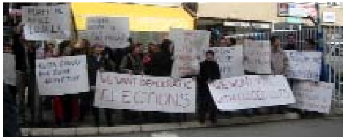
Tokom kampanje Reforma 2004, građani Pristine su protestovali za elektoralne reforme.

U martu i aprilu 2004 godine MZK, Koalicija za reformu zakona o izborima, Reforma 2004, Mreža KACI, i Lobi žena sa Kosova su učestvovali u kampanji sirom Kosova i zalagali se za novi izborni sistem. To je uključilo pisanje pisama ključnim lokalnim i međunarodnim donosiocima odluka, sastanke, medijske kampanje, konferencije za štampu, TV debate, javne obrazovne kampanje, kao i mirne demonstracije u šest regiona u znak podrške novom izbornom sistemu kojeg je promovisala Koalicija za reformu zakona o izborima na Kosovu. Preporučeni sistem bi bio kombinacija načela za otvorene liste, geografsku zastupljenost kroz višestruke izborne okruge i uravnoteženu predstavljenost polova. Elektronski i štampani mediji su izveštavali o kampanji. Mada Misija Ujedinjenih nacija na Kosovu nije promenila zakon o izborima za izbore u jesen 2004 godine, kampanja je uspela da pokrene svest javnosti o ovom pitanju i doprinela je da pitanje o reformi zakona o izborima bude prvo na dnevnom redu političkih diskusija na Kosovu.