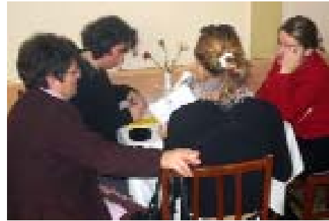
Brojanje glasova za nove članove borda

U 2004 godini MZK je također angazovala članove i partnere u proces strateškog planiranja u Djakovici u aprilu, plan je bio završen u Pristini u oktobru. Strateški plan uključuje ciljeve MZK, programe, partnere i strategiju za prikupljanje novčanih sredstava u sledećih 3 godina.