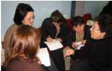
MZK nastavlja sa odubavatanjem svojih članova u strateskom planiranju u predstojecim programima.

U 2005 godini, MZK će se usmeriti na jačanje svojih članskih službi i na poboljšanje kapaciteta mreže za zastupanje. MZK će nastaviti da pruža tehničku pomoć zenskim NVO-ima na Kosovu koje čine pripadnice etničkih manjina. MZK će takođe nastaviti sa programima koje je počela u 2004 godini, a i inicirace neke nove programe.