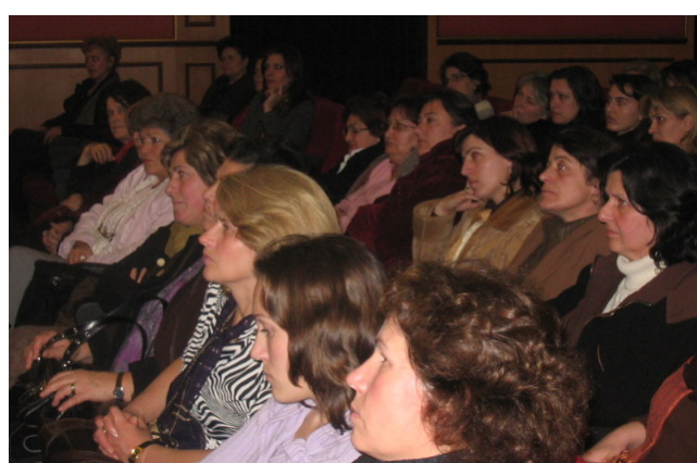
U decembru u bioskopu ABC, za zene, je prikazan film "ANATEMA". Film Agim Sopia sadrzi dozivljaje zena za vreme rata.

cembra u kino ABC, u okviru ove kampanje je prezentiran film "ANATEMA" rezisera Agim Sopi, kao i debata posle filma sa temom: "One zele dostojanstvo".