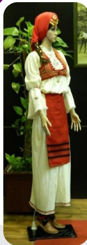
Me mbështetjen e RrGGK, anëtarët tonë si Arta po paraqesin produktet punëdore tradicionale të grave në zyret e zyrtarëve.

Grupi i dytë Punues në "Të Drejtat e Femrës mbi Trashëgiminë dhe Pronën" përfshiu shtatë organizata anëtare të RrGGK-së. Në Kosovë, mentaliteti tradicional, patriarkal dhe njohuritë e pamjaftueshme të qytetarëve, pengojnë implementimin e Ligjit mbi Trashëgiminë dhe