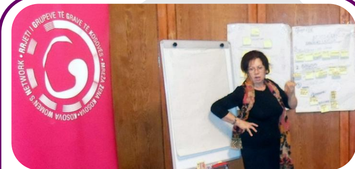
Myzaferre Ibishaga nga Forumi i Iniciativës së Grave prezanton idenë e projektit të grupit të saj.

Punëtorja ishte organizuar në kuadër të Programit të Ngritjes së Kapaciteteve të RrGGK-së. Ishte financuar nga Austrian Development Agency (ADA), si vazhdimësi e punëtorisë së parë të organizuar në dhjetor të vitit 2012.