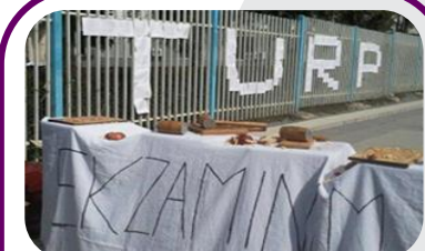
Pas tavolinës së “ekzaminimit” fjala “Turp” është formuar me anë të letrave me deklaratat personale seksiste të bëra nga parlamentarët për gratë që përjetuan dhunë seksuale.

“Have it” performoi një skicë kundër propozimit që një komitet të ekzaminojë gratë për të “verifikuar” që ato kanë përjetuar dhunë seksuale. Aktoret shtypën molla në dërrasa për prerje, duke simbolizuar dëmet që ekzaminimet do t’i shkaktonin shëndetit të grave. Më pas, pjesëmarrësit gjuajtën drejt parlamentit letra me titimet seksiste të parlamentarëve.