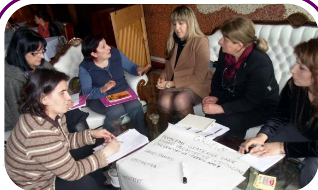
Anëtares e RrGGK-së marrin pjesë në një punëtori tre-ditore interaktive për shkrimin e projekt propozimeve.

"Edhe pse kam përvojë në shkrimin e projekt propozimeve, unë ende marrë pjesë në të tilla punëtori me qëllim që të ndajë përvoja me OJQ të tjera." tha një anëtare e "Legjenda" në Viti. "Poashtu, donator të ndryshëm kanë kërkesa të ndryshme për projekt propozime dhe trajnerë të ndryshëm kanë mënyrat e tyre të shpjegimit."