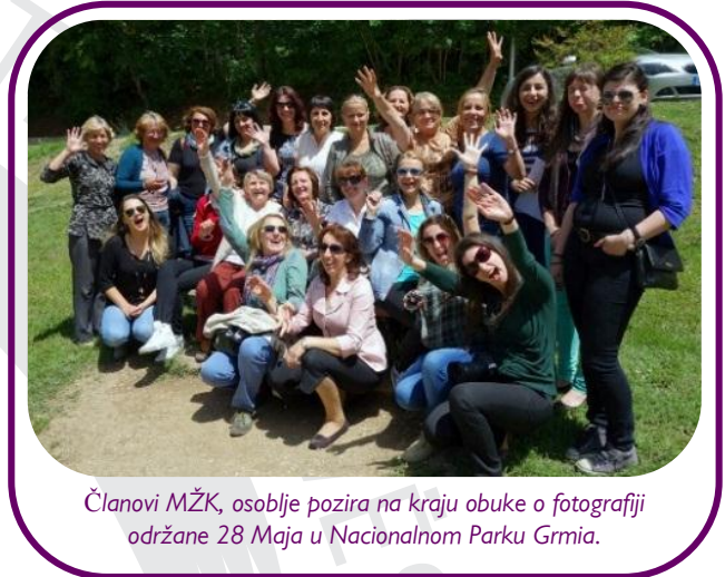
Članovi MŽK, osoblje pozira na kraju obuke o fotografiji održane 28 Maja u Nacionalnom Parku Grmija.