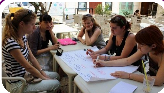
U Splitu, učesnice raspravljaju o inicijativama za osnaživanje žena.

Mlade žene iz regiona su već započele saradnju na zajedničkim inicijativama (kliknite ovde za više informacija ). Među njima, MŽK je ove godine pokrenula Inicijativu Za Osnaživanje Mladih uz podršku KtK. Ako ste mlada žena koja živi na Kosovu, molimo vas da se pridružite našoj grupi .