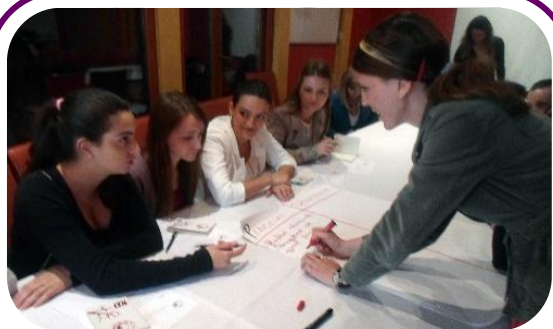
Devojke identifikiraju njihove brige i potrebe tokom IOMŽ Sastanka u Mitrovici.

„Ovaj sastanak nam je obezbedio jasne ideje za prevazilaženje poteškoća sa kojima mi kao devojke suočavamo danas“, rekla je jedna učesnica. „Takođe nam je pokazao koliko je važno da se češće okupimo i razmenjujemo iskustva.“