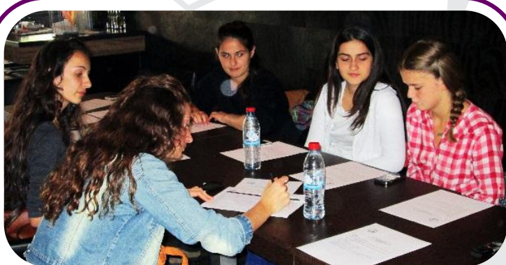
Vajzat diskutojnë strategjitë për të avokuar për praninë e psikologëve në shkolla.

“Ne nuk kemi kurajo që t’i ndajmë me prindërit tanë disa gjëra të cilat do t’i diskutonim me psikologun/-en, pasi që prindërit nuk kanë edhe aq durim që të na dëgjojnë,” shtoi një vajzë nga Ferizaji.