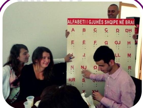
Të rinjët lexojnë alfabetin e gjuhës shqipe në tabelën e Brajlit të krijuar nga Komiteti i Grave të Verbëra të Kosovës.

Iniciativa e Komitetit të Grave të Verbëra të Kosovës është përkrahur nga Fondi i Grave të Kosovës në RrGGK.