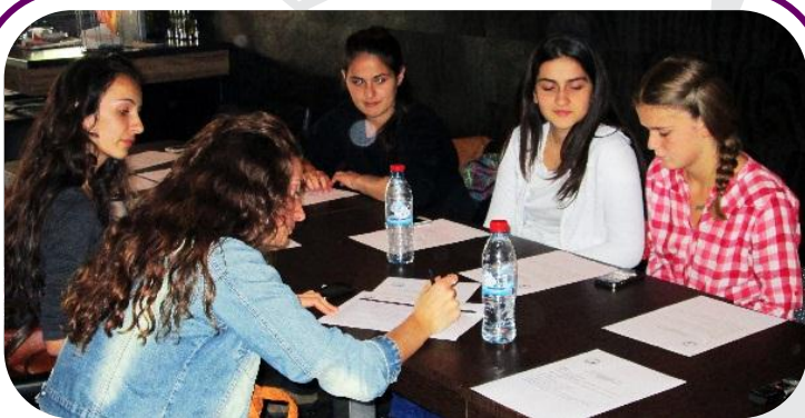
Vajzat diskutojnë strategjitë për të avokuar për praninë e psikologëve në shkolla.

“Ne nuk kemi kurajo që t’i ndajmë me prindërit tanë disa gjëra të cilat do t’i diskutonim me psikologun/-en, pasi që prindërit nuk kanë edhe aq durim që të na dëgjojnë,” shtoi një vajzë nga Ferizaji.