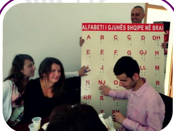
Të rinjët lexojnë alfabetin e gjuhës shqipe në tabelën e Brajlit të krijuar nga Komiteti i Grave të Verbëra të Kosovës.

Iniciativa e Komitetit të Grave të Verbëra të Kosovës është përkrahur nga Fondi i Grave të Kosovës në RrGGK.