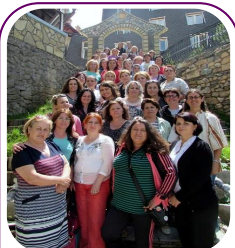
Grupet e Avokimit të Grave (GAG) nga 15 komuna të ndryshme morën pjesë në punëtorinë e dytë 26-27 Brod, Dragash

Pas këtij prezentimi, studentët patën mundësinë të bëjnë pyetje të ndryshme. "Ky ka qenë njëri ndër takimet më të mira që kam marrë pjesë ndonjëherë. Ju bëtë një prezantim të shkëlqyeshëm dhe ne u njdemë të lirë të bëjmë çfarëdo pyetje që donim", tha njëri nga pjesëmarrësit në takim.