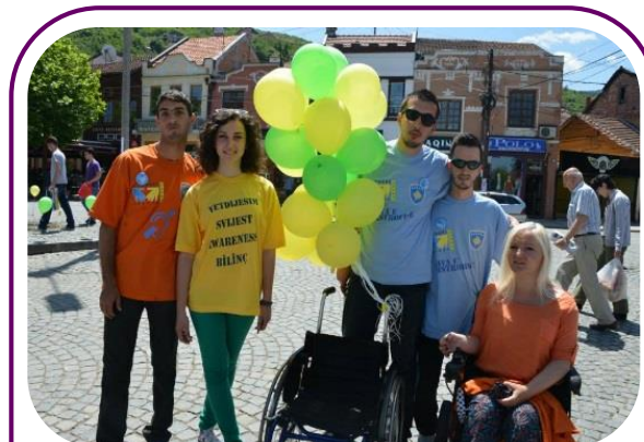
OPDMK kërkon të drejta për personat në karrige me rrota Pziren 27 Maj.

OPDMK gjithashtu do të dorëzojë një dokument në të cilin detajohen të drejtat dhe kërkesat e tyre, dhe ku identifikohen pikat e tjera të qasjes në ndërtesat publike, të cilat duhet të rregullohen nga institucionet përgjegjëse për zgjidhjen e këtyre problemeve.