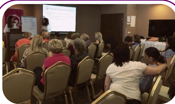
RrGGK organizoi “organizoi punëtorinë e titulluar “Bërja e Hulumtimit: Metodat Sasiore dhe Cilësore.” me 9 qershor.

Kjo nismë është mbështetur nga Fondi i Grave të Kosovës (FGK) i RrGGK-së, i financuar nga Kvinna till Kvinna (KtK).