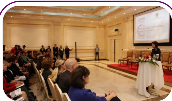
Presidentja e Kosovës Atifete Jahjaga flet në prezantimin e raportit Barazia Gjinore në Biznes, organizuar nga CLE me 3 qershor në Prishtinë.

Të gjetuarat nga ky raport do të ndihmojnë Programin për Përmbardim dhe Legjislacion Komercial (CLE) dhe programet e tjera të USAID-it për të zhvilluar aktivitetet e ardhshme duke e kuptuar më mirë se si të adresojnë dallimet reale dhe të perceptuara gjinore të pjesëmarrjes në ekonomi.