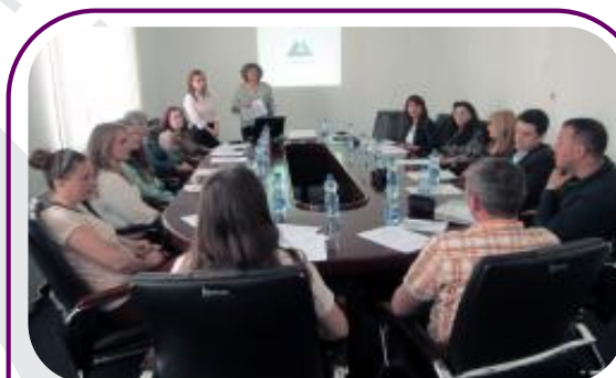
Femrat dhe meshkujt diskutojnë për temën “Të drejtat e grave në ndarjen e pasurisë dhe të drejtat e trashëgimit” në prezantimin e organizuar nga Partners Kosova më datën 28 maj në Lipjan