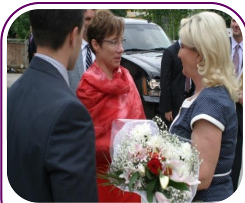
Ambasadorja e SHBA-ve në Kosovë, me 1 korrik, vizitoi OJQ-në Liria