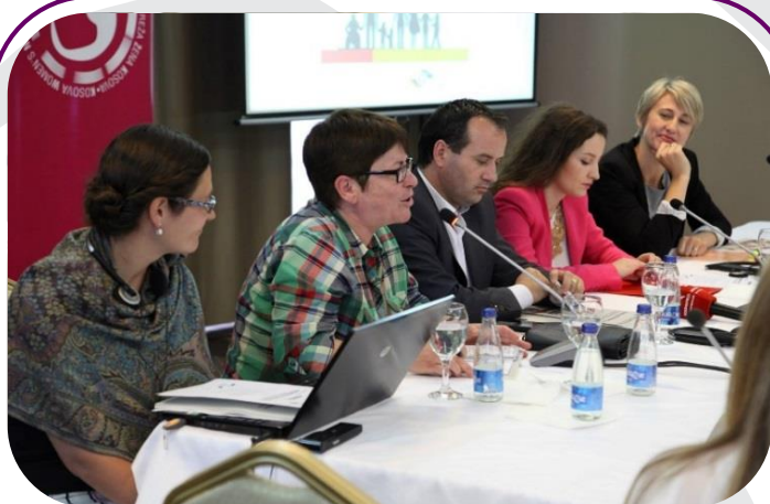
RrGGK, MPMS dhe GIZ zyrtarisht publikuan raportin e ri dhe inovativ të titulluar Buxheti për mirëqenien sociale.

Qarkorja buxhetore egzistuese dhe amendamentet e propozuara për Ligjin për Barazi Gjinore inkurajojnë përdorimin e buxhetimit të përgjegjshëm gjinor si pjesë e procesit buxhetor të Kosovës. Ky raport jep një shembull konkret të asaj se si mund të realizohet buxheti i përgjegjshëm gjinor brenda një ministrie.