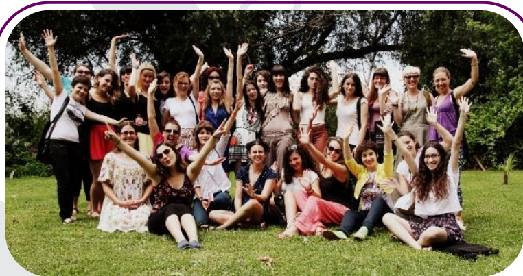
Shkolla Verore Feministe mbledhi rreth 20 vajza nga Kosova dhe Serbia në Ohër të Maqedonisë, nga 15 deri më 21 korrik.

Shkolla Verore Feministe u organizua nga RrGGK, Alternative Girl's Center nga Krushevac, Serbi dhe Association Dea Dia nga Kovacica, Serbi si një iniciativë feministe paqe-ndërtuese për vajzat. Kjo iniciativë u përkrah nga Kvinna till Kvinna .