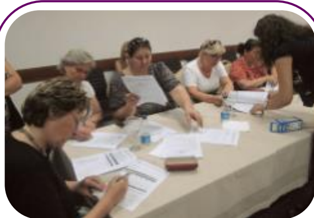
Me 8 korrik, 14 organizata anëtare të RrGGK kanë përfituruar grante nga Fondi i Grave të Kosovës (FGK) i RrGGK-së, mbështetur nga Austrian Development Agency (ADA), me shumë totale prej €43,806.

Organizatat që përfituan grante dhe iniciativat e tyre përfshijnë: