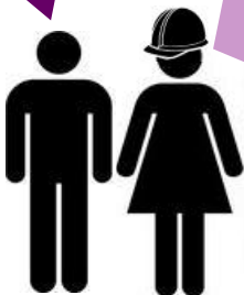
Plate i dnevnice

„To nije istina! Postoje mnoge stvari koje ja mogu uraditi, kao držati znakove na zonama izgradnje, služiti kao arhitekt, upravljati radnicima, farbati zidove, i mnoge druge stvari takođe! Zašto bi ti trebao imati više koristi od ovog javnog novca od mene?“