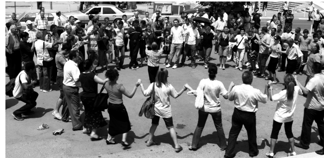
Qytetarët vallëzuan në qendër të Prishtinës pas shpalljes simbolike të pavarësisë së Kosovës.

Pas shpalljes qytetarët vallëzuan në rrugë. Ngjarja përfundoi në mënyrë paqësore. Ky manifestim u organizua në kohën e mbajtjes së takimit mes delegacionit qeveritar Kosovar dhe Sekretares së Shtetit të SHBA-ve në Uashington, ku diskutoheshin nyja politike e shkaktuar nga statusi i Kosovës. Në protestë morën pjesë rreth 200 persona dhe u mbulua nga mediat në Kosovë dhe jashtë saj.