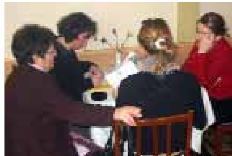
Numrimi i votave për zgjedhjen e anëtarëve të ri të Bordit.

Në vitin 2004, RRGGK po ashtu angazhoi anëtare dhe partnerë në procesin e planifikimit strategjik, që rezultoi me planin strategjik të RRGGK-së për 2005-2008. Nisma e këtij plani ishte në Gjakovë, ndërsa finalizimi u bë në Prishtinë në muajin tetor. Plani strategjik përfshin objektivat e RRGGK-së, programe, partnerë, dhe strategji për shtim fondesh për tre vitet e ardhshme.