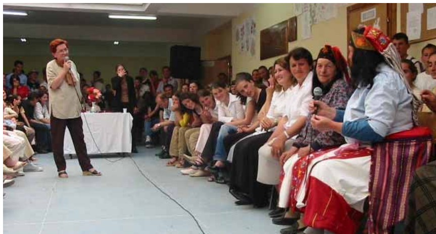
Gjatë një shfaqje të fushatës “Të njohim të drejtat”, artistet e njohura bashkëbisedojnë me gratë nga viset malore të Hasit.

Fushata ka filluar me 29 nëntor në Prishtinë, duke shënuar Ditën Ndërkombëtare Kundër Dhunës Ndaj Gruas. Shfaqja është përsëritur në Prizren me 2 dhjetor dhe në Mitrovicë me 3 dhjetor. Fushata do të vazhdojë në 2005 nëpër të gjitha komunat e Kosovës. Ky projekt financiarisht ka qenë i mbështetur nga UNIFEM. RTV 21 ka qenë sponsor medial.