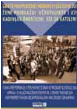
Broshura “Gratë Propozojnë” thekson rekomandimet e grave për platformat e partive politike.