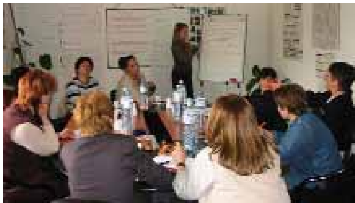
Plani strategjik me anëtarët e Bordit dhe stafin e Rrjetit.

Në janar të vitit 2004, RRGGK, e hapi zyrën e parë në Prishtinë me përkrahje të STAR Network of World Learning, Fondacioni i Kosovës për Shoqëri të Hapur dhe Programi kanadezo-kosovar për iniciativë vendore. Rrjeti pastaj, ndërroi zyrat në shtator të vitit 2004 në lokacionin e tanishëm në qendër të Prishtinës.