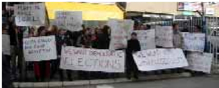
Si pjesë e fushatës “Reforma 2004” qytetarët e Prishtinës protestojnë për reformimin e ligjit zgjedhor.

Në mars 2004, RRGGK-ja së bashku me Lobin e Grave të Kosovës, iu bashkangjitën koalicionit për ligjin reformues zgjedhor, REFORMA-2004. Këtu përfshihej shkrimi i letrave për vendim marrësit kryesor lokal dhe ndërkombëtar, takime, fushatë mediash, konferenca për shtyp, debate televizive, fushata për edukim publik, si dhe protesta paqësore në 6 rajone për të përkrahur sistemin e ri zgjedhor të promovuar nga koalicioni i ligjit reformues zgjedhor në Kosovë. Sistemi i rekomanduar kombinonte paraqitjen gjeografike përmes rajoneve zgjedhore dhe balancimin e barazisë gjinore. Fushata gjerësisht mbulohej nga mediat elektronike dhe të shkruara. Edhe pse Misioni i Kombeve të Bashkuara në Kosovë nuk ndryshoi ligjin për zgjedhjet e vjeshtës së vitit 2004, fushata kishte sukses në ngritjen e vetëdijes publike dhe kontriboi që këto çështje të ligjit reformues zgjedhor të dalin në diskutimet politike në Kosovë.