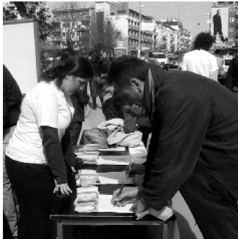
Građani potpisuju peticiju pozivajući vladu da stvori strategiju za borbu protiv raka dojke i da završe izgradnju onkološkog instituta.