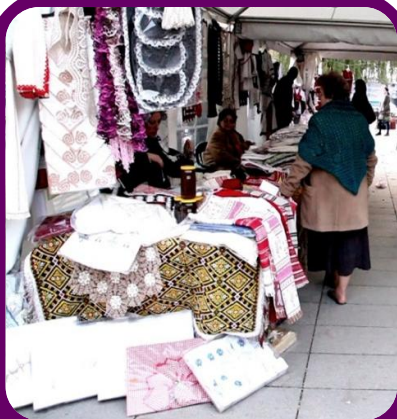
Na Bulevaru Majka Tereza, klijenti pregledaju proizvode napravljene od žena iz Opolja, Dragaš.