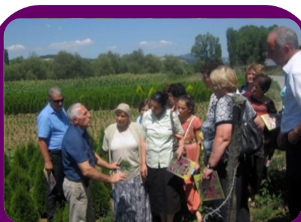
Članice Asocijacije Žena Poljoprivrednica iz Malog Kruševa uče tehniku setve i poslovanja.

„Iskustvo nije bilo samo obrazovno, nego i za osnaživanje. Za neke žene, bio je prvi put da su one putovale van njenih sela. Iako je projekat završen u Julu, osam žena planiraju da otvore svoje biznise u budućnosti, gde će one nastaviti da koriste znanje koje su stekle kroz ovu inicijativu.