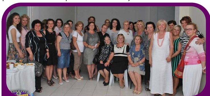
Gruaja Hyjnore proslavlja otvaranje njihovog novog prostora, pruženog besplatno od strane Opštine Gnjilane.

Pored sticanja znanja o svojim pravima, kroz ovu inicijativu su 36 žena imale mogućnosti da prodaju svoje proizvode na sajmovima. Četiri žena iz skloništa žena su zaradile približno 400€ u celosti, od prodaje njihovih proizvoda. Ova inicijativa je time doprinela osnaživanju žena, i ekonomski i u pravcu njihovih povećanih učešća u procesima donošenja odluka kod kuće.