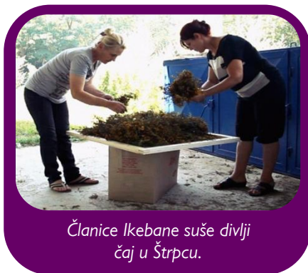
Članice Ikebane suše divlji čaj u Štrpcu.

Među-etnička grupa žena u Štrpcu je uvek sanjala o osnivanju jedne organizacije preko koje bi mogli da skupljaju i prodaju biljne čajeve. Njihov cilj je bio da pripreme proizvode sa kvalitetnim sastojcima na ekološki način. Neka medicinska bilja s kojim su želeli da rade su dobro poznate u farmaceutskoj industriji. Sa podrškom Fonda Žena Kosova (2,707€) i Caritas-a iz Švajcarske, one su bile u stanju da realizuju svoj san, da otvore svoju organizaciju, „Ikebana”.