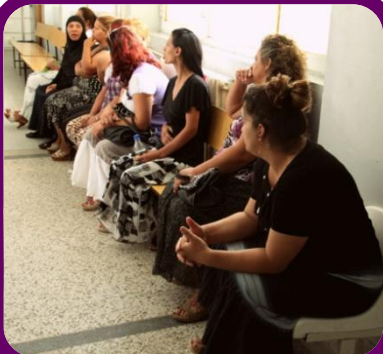
Žene čekaju na red, u poseti ginekologa besplatno.