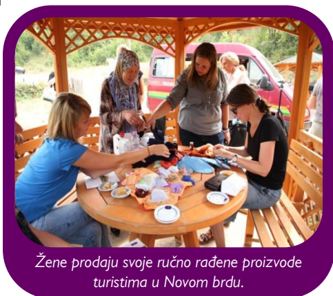
Žene prodaju svoje ručno rađene proizvode turistima u Novom brdu.