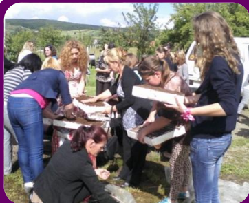
Žene uče tehnike za setvu sadnica.