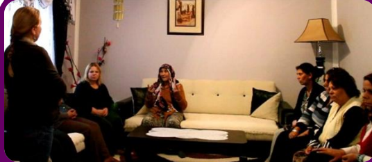
Žene diskutuju izazove s kojima se suočavaju tokom obuke u Prizrenu.

Više od 400 žena su dobile informacije preko Folejine podržane inicijative od strane Fonda Žena Kosova (2,740€).