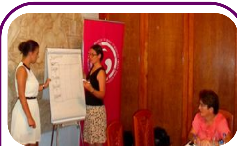
MŽK članice bruse veštine narativnog i finansijskog izveštavanja u organizovanom obučavanju koje je organizovano 29. jula, u Prištini

MŽK je posetio 81 organizacija članica tokom 2011-2012 godine, kako bi procenio napredak u sprovođenju Kodeksa Etike i Odgovornosti MŽK-a, za koji su se sve članice složile da ga ispune. Na osnovu intervjua, MŽK je stvorio individualni izveštaj za svaku organizaciju sa njihovim informacijama, potrebama, prednostima i slabostima, u vezi njihovog organizacionog funkcionisanja. MŽK je takođe stvorio svoj Plan za usluge članstva na osnovu intervjua sa članovima, ličnih zahteva članova, ocenjivanja pratnje organizovanih aktivnosti MŽK-a i nadgledanja članova osoblja MŽK-a.