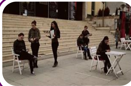
MŽK organizuje akciju na ulici kao deo Regionalnog Foruma Mladih Feministkinja 2013, Nov. 13.