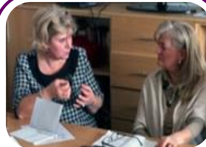
Članice MŽK-a diskutiraju ideje i dele iskustva, za žensko ekonomsko osnaživanje.

Nakon ovog sastanka, MŽK se takođe sastao sa „Global Goods“ u Njujorku, neprofitna organizacija koja podržava žene u marketingu svojih proizvoda u SAD-u, kako bi diskutovali koje bi korake žene na Kosovu trebale da preuzmu kako bi reklamirali i prodali svoje proizvode u inostranstvu. Sastanak je otkrio da bi žene na Kosovu imale mnogo posla ispred kako bi pristupili tržištima SAD-a, posebno vezano za razvoj proizvoda.