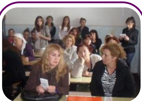
Žene u Opštini Srbica, prisustvuju predavanjima organizovanim od strane NVO Prehja, u vezi raka dojke.

Neke organizacije i njihovi korisnici su nastavili sa preuzimanjem dodatnih inicijativa na dobrovoljnoj osnovi o gorepomenutim pet Strateških ciljeva MŽK-a, Fond je pružio odličnu mogućnost za članice da doprinesu u pravcu zajedničkog realizovanja zajedničke strategije MŽK-a. Kroz Fond, članice su takođe osnažile svoje odnose sa mrežom i drugim članovima. Organizacije članice MŽK-a su zajedno radile i podržavale jedna drugu u pisanju predlog projekata i obavljanju zajedničkih inicijativa.