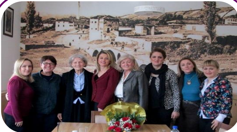
MŽK posećuje Gradonačelnika Đakovice, gđu Mimozu Kusari-Lila, prvog Gradonačelnika ženu na Kosovu, dana Jan. 20.

Delimično kao rezultat gorepomenutih među-opštinskih i prethodnih napora sa ženskim grupama za zastupanje rodne jednakosti, više žena se kandidovalo za gradonačelnika tokom opštinskih izbora 2013.godine na Kosovu, nego što je to slučaj bio ranije. Mimoza Kusari-Lila je postala prva žena Gradonačelnik koja je ikada bila izabrana (u Opštini Đakovica). U nastavku, procenjuje se da su 51 žena izabrane na položajima odbornica skupštine (a nisu dobili svoja mesta zbog kvote), u poređenju za 16 u 2007 godini. 1 To je značilo povećanje učešća žena u Skupštini Opštine u približno 30% do 34%. 2 Više je žena kandidovalo za Gradonačelnika nego ikada ranije, i Mimoza Kusari – Lila je izabrana kao prva žena Kosova za Gradonačelnika (u Opštini Đakovici sa strankom AKR ).