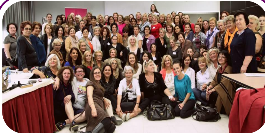
Članovi, osoblje MŽK-a, okupili su se na povlačenju MŽK-a, u Draču, Albaniji 3-6 Okt.

U ovom izveštaju, diskutovali smo o postignutim napretcima i rezultatima postignutim tokom 2013, za svaki od ovih ciljeva, uključujući i ključne aktivnosti koje su doprinele postizanju ovih rezultata. Ovaj izveštaj takođe sadrži korisne informacije o našem budžetu, podržiocima, Odboru Direktora, Savetodavnom odboru, osoblju, pripravnicima, volonterima i članicama/ovima.