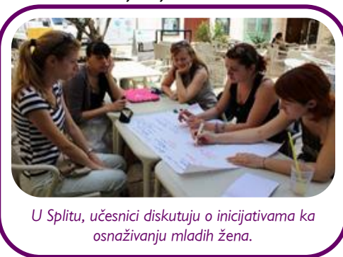
U Splitu, učesnici diskutuju o inicijativama ka osnaživanju mladih žena.

Devojke sa Kosova i Srbije sastale su se od 7-11 Juna u Splitu, Hrvatska. A pridružile su im se i devojke is Hrvatske, Armenie i Azerbejdžana. One su razgovarale o pravima lezbijki, gejeva, biseksualnih i transrodnih (LGBT) osoba, i razmenile su informacije i iskustva. One su takođe prisustvovala paradi za prava LGBT osoba. Studijske posete u podstakle jaka prijateljstva