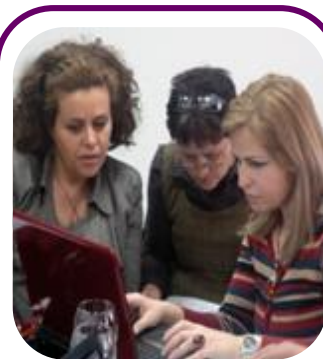
Učesnice sarađuju u izradi saopštenja za javnost tokom radionice PR MŽK-a u Apr. 19.

Oko 37 predstavnica organizacija članica MŽK napunilo je salu Hotela Priština dana 29.jula za obuku o narativnom izveštavanju, finansijskom izveštavanju i budžetiranju. Članice MŽK su zatražile podršku za ove tri teme.