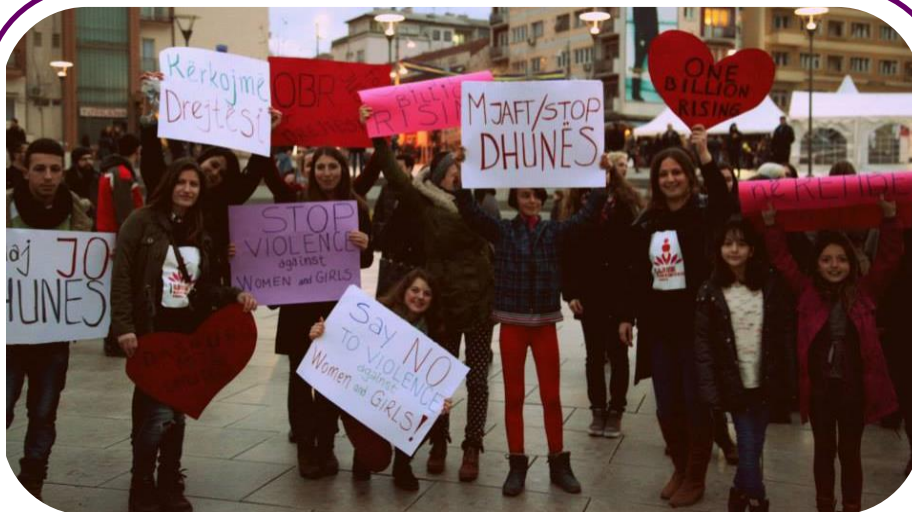
One Billion Rising Kosovo je sakupila muškarci i žene da štrajkuju, plešu i da se dignu protiv nasilja nad ženama, na 14 Februara.