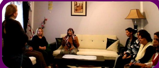
Gratë duke i diskutuar sfidat me të cilat ballafaqohen gjatë një trajnimi në Prizren.

Më shumë se 400 gra kanë marrë informata nëpërmjet nismës së Folesë , të mbështetur nga Fondi i Grave të Kosovës (2,740 €).