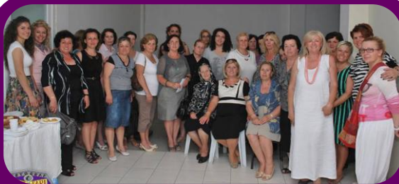
Gruaja Hyjnore feston hapjen e zyrës që iu është dhënë pa pagesë nga Komuna e Gjilanit.

Përveç fitimit të njohurive për të drejtat e tyre, nëpërmjet kësaj nisme 36 gra kanë patur mundësi t’i shesin produktet e tyre në panairë. Katër gratë nga strehimorja e grave kanë fituar afërsisht 400 euro në total nga shitja e produkteve të tyre. Kjo nismë ka kontribuar në fuqizimin e grave, si nga ana ekonomike ashtu edhe në drejtim të rritjes së pjesëmarrjes në procesin e vendim-marrjes në familje.