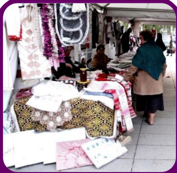
Në Sheshin Nëna Tereza, klientët duke i shikuar prodhimet e bëra nga gratë prej Opoje të Dragashit.