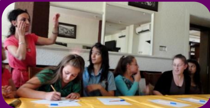
Krenarja duke përkthyer për të rinjët e shurdhër, duke i inkurajuar t'i diskutojnë nevojat e tyre.

Krenarja nisi rrugën e saj si aktiviste e të drejtave të grave gjatë punës si interprete e gjuhës së shenjave gjatë takimeve të Rrjetit të Grave të Kosovës. Ajo mori pjesë në takimin e saj të parë në vitin 2012 si interprete për Shoqatën e Personave të Shurdhër. “Gjatë atij takimi mësove shumë informata të reja për OJQ-të dhe punën e tyre.” “Kur pashë mundësitë që rrjeti i ofron për gratë,