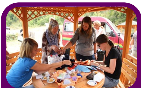
Gratë duke ua shitur prodhimet e tyre turistëve në Novobërdë.