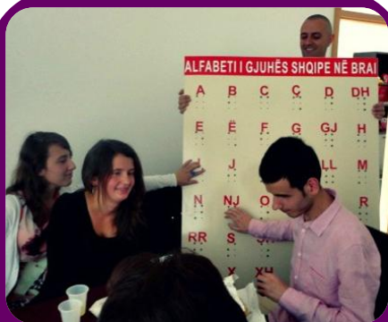
Të rinjtë e verbër duke testuar Tabelat e Brailit të dhuruara nga Komisioni për shkolla.

Komisioni i Grave të Verbëra kërkoi të inkurajohen të rinjtë për të mbrojtur të drejtat e tyre për arsimim, mbështetur nga Fondi i Grave të Kosovës (€2,878).