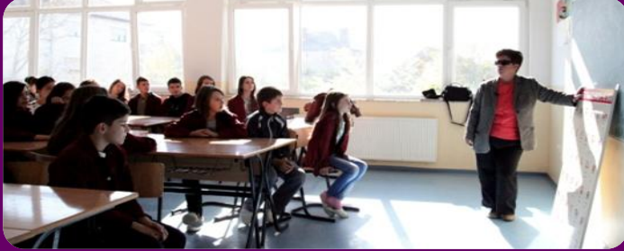
Bajramshahe duke ua shpjeguar Brailin nxënësve në Prishtinë.

tabelat e alfabetit të Brajlit në dy shkolla fillore në Prishtinë. Tabelat me madhësi pothuaj sa ajo e shtatit të një njeriu, janë përdorur për të shpjeguar alfabetin e Brajlit nxënësve të shkollave publike. Kështu, prezantimi i tabelave ka përfshirë gjithashtu edhe organizimin e leksioneve në alfabetin e Brajlit për rreth 140 nxënës dhe mësime, si dhe ndarjen e informatave për nevojat e veçanta që kanë nxënësit e verbër.