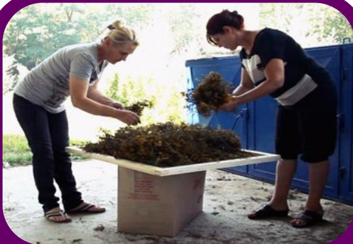
Anëtarët e Ikebanas duke tharë barishtet në Shtërpce.

Themelimi i një organizate të re nuk është detyrë e lehtë. Anëtarët e Ikebanas kishin nevojë për mbështetje në mënyrë që të vinin në funksion sistemin, politikat dhe procedurat në mënyrë që organizata e tyre të funksionojë