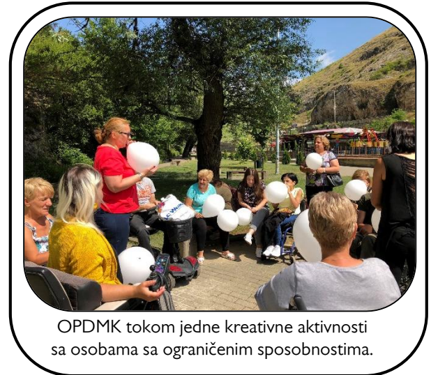
OPDMK tokom jedne kreativne aktivnosti sa osobama sa ograničenim sposobnostima.

Uz podršku FGK, OPDMK je u okviru inicijative „Zdravlje za sve“ održao sastanak sa predstavnicima Direktorata za zdravstvo, na kome se zalagao da se obezbedi bar jedan hidraulički sto, koji bi ove žene koristile za ginekološke posete. Takođe je OPDMK organizovao i predavanja, savetodavne skupove u kojima je učestvovalo 61 osoba. Handikos Kosova je, uz podršku FGK u okviru inicijative “Depresija kod majki dece sa ograničenim sposobnostima i kod osoba sa ograničenim sposobnostima” održao terapeutske sesije, sastanke i predavanja od kojih je korist imalo 47 žena. Mala Kruša je takođe uz podršku od strane FGK održala predavanja o bolestima kao što su rak dojke, samopregled dojke, rak grlića materice, klimaks, visok krvni pritisak i dijabetičko stopalo. Na ovim predavanjima je učestvovalo 80 žena.