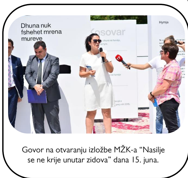
Govor na otvaranju izložbe MŽK-a “Nasilje se ne krije unutar zidova” dana 15. juna.

Od aprila ove godine, nasilje u porodici i seksualno uznemiravanje će biti kažnjavano kao krivična dela, i ista su definisana u Krivičnom zakoniku Republike Kosovo. Takođe je uspostavljena budžetska linija za prihvatilišta i centre za dnevnu skrb koji pružaju usluge žrtvama porodičnog nasilja i rodno zasnovanog nasilja. Takođe, bilo je i inicijativa za usvajanje Istambulske konvencije u Ustav Kosova, proces koji je ostao na pola puta delimično zahvaljujući raspuštanju Skupštine Kosova. Ipak, tokom ove godine, MŽK nije prekinula sa inicijativama zalaganja za pošteno sprovođenje izmena i dopuna Krivičnog zakonika i izvršavanje budžeta za 2019. godine. Tokom novembra, zajedno sa Grupom za bezbednosna i rodna pitanja, MŽK je zagovarala u Ministarstvu rada i socijalne zaštite da se odredi budžet za prebivališta i dnevne centre, kako je definisano u budžetu za 2019. godinu. Na ceremoniji objavljivanja OEBS o “Anketa o dobrobiti i bezbednosti žena na Kosovu”, MŽK je pozvala da se prepozna rad i doprinos ženskih skloništa i nevladinih organizacija, i da taj doprinos pronađe i podršku domaće vlade.