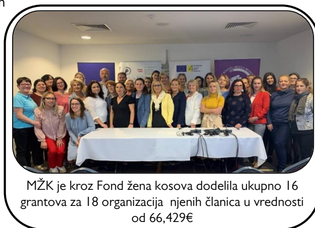
MŽK je kroz Fond žena Kosova dodelila ukupno 16 grantova za 18 organizacija njenih članica u vrednosti od 66,429€

Tokom ove godine, kroz Fond žena Kosova (FŽK), MŽK je dodelila ukupno 16 grantova za 18 organizacija, svojih članica. Od njih, dva granta u Partnerstvu za promene (do 8,000 evra) dodeljeno je za četiri organizacije koje će sprovesti u partnerstvu i grantovi individualnih zagovaranja (do 4.000 evra i 5000 evra) dodeljeno je za 14 organizacija članova. Ove godine FŽK je podržala Austrijska agencija za razvoj (ADA) kroz inicijativu MŽK-a „Unapređenje inicijative za prava žena“, u iznosu od 48,000 evra i Kancelarija Evropske unije na Kosovu kroz inicijativu MŽK-a „Jačanje učešća žena u politici“ u iznosu od 20,000 evra. Ukupan iznos koji je dodeljen tokom 13. runde grantova je 66,429.50 evra. Grantovi u Partnerstvu za promene i ranije su povećali saradnju među organizacijama članicama, omogućujući organizacijama iz različitih regiona na Kosovu da ujedine snage i da se zajedno zalažu. Očekuje se da će se takve saradnje nastaviti kroz ove grantove. Na primer NVO Rikotta u partnerstvu sa organizacijom Ženski centar ATO razvile su inicijativu „Ekonomsko jačanje i podizanje kapaciteta žena na Prevalcu i okolnim selima“. A Udruženje žena povratnica Naš dom u partnerstvu Ženski centar za ruralni razvoj razvile su inicijativu „Partnerstvo za razvoj (prijateljske sredine za razvoj preduzetništva žena“. Pored ove dve inicijative u partnerstvu, ostale inicijative koje je podržala MŽK, a koje će nastaviti i tokom 2020. godine su: