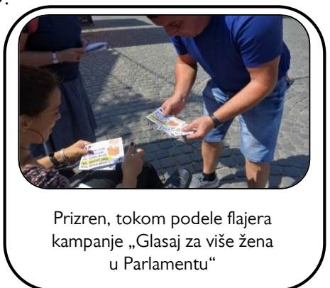
Prizren, tokom podele flajera kampanje „Glasaj za više žena u Parlamentu“

Sa Koalicijom za ravnopravnost, Lobijem i MŽK-om, žene iz oblasti politike i civilnog društva i žene glasači su saradivale oko pitanja koja su za njih bila važna tokom 2019. godine. Lobi se u bliskoj saradnji sa ženama glasačima iz njihovih opština, članicama Lobija, zalagao za pitanja koja žene smatraju prioritetima. Takođe, tokom gore pomenute petodnevne kampanje u 17 opština na Kosovu, obuhvatajući i sprske opštine, dobrovoljci iz organizacija članica MŽK-a i članice Lobija su delili flajere ove kampanje, idući od vrata do vrata, kako bi diskutovali o bitnosti glasanja u što većem broju za žene u Parlamentu na prevremenim parlamentarnim izborima, koji su održani 6. oktobra 2019. godine. Takođe je Lobi tokom ove godine ukupno održao 62 sastanaka između žena i devojaka i onih koji sastavljaju politike, 51 sastanaka sa ženama glasačima, i preduzeo je 62 inicijativa za zagovaranje za pitanja koja žene smatraju prioritetom.