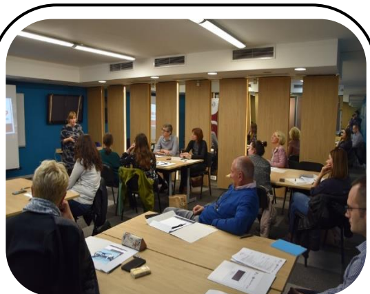
Skopje, tokom obuke trenera o Polnom Odgovornom Budžetiranju, gde su prisutna bila 7 organizacija iz Zapadnog Balkana i Moldavije.

MŽK je deo regionalne inicijative uz šest organizacija iz zemalja Zapadnog Balkana, kao što su Albanija, Bosna i Hercegovina (BiH), Kosovo, Severna Makedonija, Crna Gora i Srbija kao i Moldavija, u cilju podizanja kapaciteta koji se tiču ROB-a, razvoja i jačanja regionalne mreže za ROB i zagovaranje za odgovorne rodne politike. Kapaciteti 16 osoba su se razvili na obuci za trenere, na kojoj su učesnici bili osoblje MŽK-a. Takođe je i poziv za grantove i za lokalne organizacije otvoren tako da 4 grassroot organizacije na Kosovu povećaju svoje kapacitete kao deo ove mreže i da mogu da naprave izmene u dokumentima ili budžetskim programima u njihovim opštinama, kao i da doprinesu institucionalizaciji ROB-a.