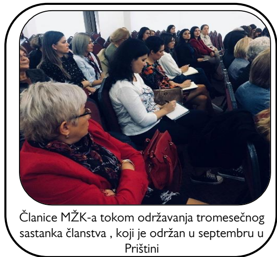
Članice MŽK-a tokom održavanja tromesečnog sastanka članstva, koji je održan u septembru u Prištini

MŽK je organizovala tri redovna sastanka članstva, po jedan u svakom tromesečju, preko kojih su 134 članice, partnerke i razni podržavaoci razmenili informacije i preko kojih su se informisale o aktivnostima koje su je konstantno održavala MŽK i ostale organizacije. Od 2015. godine, ukupno je 1,110 žena i muškaraca učestvovalo na redovnim sastancima članstva. Tokom sastanaka, članovi MŽK-a su odigrali bitnu ulogu u saradnju prema sprovođenju strategije MŽK-a, kao i u praćenju i oceni rada MŽK-a.