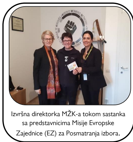
Izvršna direktorka MŽK-a tokom sastanka sa predstavnicima Misije Evropske Zajednice (EZ) za Posmatranja izbora.

Ove godine, MŽK je nastavila zalaganje za usklađivanje Zakona o ravnopravnosti polova sa važećim izbornim zakonima., kroz zagovaranje kod zvaničnika na Kosovu, a u saradnji sa predstavnicima EU. Ka postizanju ovog rezultata, MŽK je u saradnji sa organizacijama članicama, preuzela kampanju „Glasaj za više žena u Parlamentu“, pozivajući na jednaku zastupljenost žena i muškaraca i na sprovođenje Zakona o ravnopravnosti polova na prevremenim parlamentarnim izborima 2019. godine. Šta više, izvršna direktorka je održala nekoliko sastanaka tokom ove godine sa zvaničnicima i raznim predstavnicima, obuhvatajući šeficu Misije Evropske unije (EU) za posmatranje izbora i predsednicu Centralne izborne komisije, pozivajući na sprovođenje Zakona o ravnopravnosti polova i usklađivanje Zakona o opštim izborima sa njim.