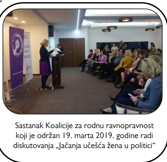
Sastanak Koalicije za rodnu ravnopravnost koji je održan 19. marta 2019. godine radi diskutovanja „Jačanja učešća žena u politici“

Tokom ove godine, Lobi je održao 2 sastanka gde su učestvovali 66 učesnika, uključujući službenike za ravnopravnost polova, odbornika, predstavnika organizacija članova MŽK-a iz raznih opština i članove osoblja MŽK-a. prvi sastanak je sazvan sa ciljem da se planiraju i zamišljaju strategije da se ojača učešće žena u politici i u procese donošenja odluka na Kosovu, dok je drugi sastanak služio za izveštavanje uspešnih pokreta i sprovođenje strategija za 2019. godinu.