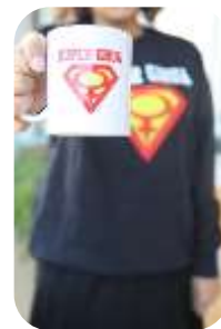
MŽK Merch - "Super žena" Šolja i džemper dostupni uz donacije

Takođe je preduzeto nekoliko koraka za poboljšanje veb stranice MŽK radi bolje podrške prikupljanju sredstava na mreži. Ovo uključuje novi odeljak sa promotivnim materijalima MŽK kao što su šolje, majice, duksevi i sveske. Sva