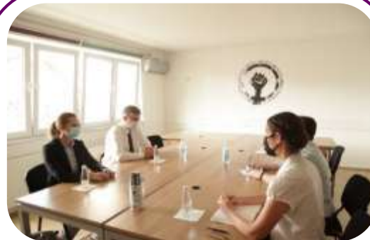
Predstavnici MŽK-a i EULEX-a razgovaraju o poboljšanju među-institucionalnog odgovora na rodno zasnovano nasilje na Kosovu u septembru 2020.godine

Dalje, putem pravne pomoći, MŽK-a je podržala žene da traže pravdu za nasilje koje su pretrpele, direktno doprinoseći poboljšanoj primeni. Tim RZN-a je podržao otprilike 25 slučajeva tokom ovog perioda, informišući žene o njihovim pravima, institucijama kojima mogu da se obrate i upućujući ih kod pravnika za pravnu pomoć. Žene su upućene u relevantne pravosudne institucije, kao i psihologe u skloništima radi savetovanja. Kao rezultat ovih uputstava, advokat MŽK-a je pokrenuo postupak koji se odnosi na pet tekućih slučajeva u sudovima i drugim institucijama. MŽK je takođe imala sudske posmatrače koji su pratili slučajeve RZN-a na sudovima, ka identifikovanju preporuka za poboljšanje sprovođenja zakonskog okvira.