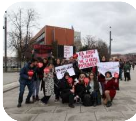
Marš osoblja MŽK za ženska prava u martu 2020. godine

Poboljšati svest i pažnju među zvaničnicima i građanima u suočavanju sa rodno zasnovanim nasiljem, uključujući porodično nasilje, silovanje i seksualno uznemiravanje Kao i prethodnih godina, 8. marta, na Međunarodni dan žena, MŽK se pridružila protestnom maršu „Mi marširamo,