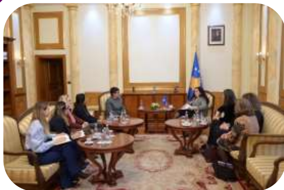
Predstavnice MŽK-a su se sastale sa prvom ženom koja je bila na mestu predsednika Skupštine Kosova, Vjosom Osmani, u februaru 2020. godine.

MŽK je nastavila rad i napore na povećanju učešća žena u dijalogu između Kosova i Srbije. Ove godine, MŽK je bila deo nekoliko sastanaka sa drugim OCD koji su kulminirali uspostavljanjem Platforme civilnog društva za dijalog između Kosova i Srbije u septembru. Održano je nekoliko koordinacionih sastanaka kojima je prisustvovalo osoblje MŽK-a. Jedan od glavnih događaja bio je sastanak OCD-a i premijera Avdulaha Hotija, gde su MŽK i organizacije članice postavile pitanje primene Rezolucije UN-a 1325 u Dijalogu.