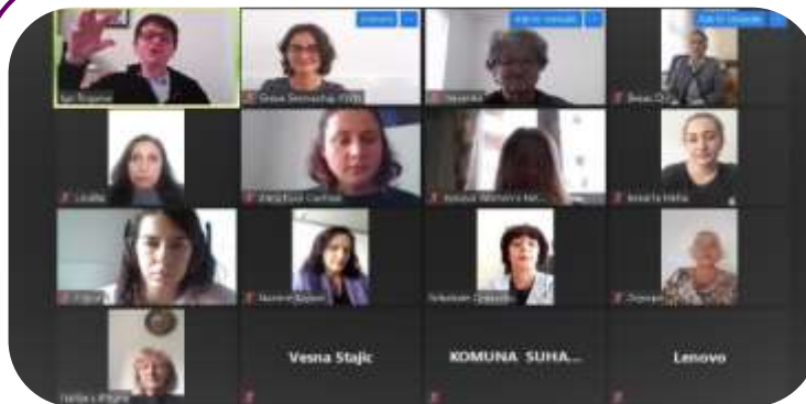
Članice Lobija i Koalicije održavaju zajednički onlajn sastanak u novembru 2020.

Koalicija za ravnopravnost osnovana je 22. juna 2018. Nju čine žene u politici na nacionalnom i lokalnom nivou, kao i OCD koje vode žene. Koalicija nastoji da podrži i osnaži svoje članice da poboljšaju položaj žena u politici i donošenju odluka i da promovišu unapređenje rodne ravnopravnosti na Kosovu. Učesnici su se obavezali da će raditi na ispunjavanju ove zajedničke misije, bez obzira na njihove političke sklonosti, pol, starost, etničku pripadnost, sposobnost, religiju, region, nivo obrazovanja ili socijalno-ekonomski status.