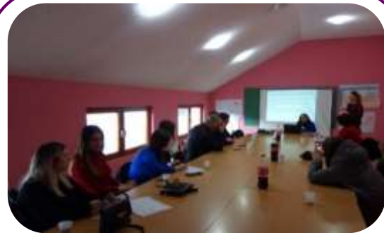
Organizacija članica MŽK-a "Hareja" održava okrugli sto o sprečavanju nasilja i važnosti prijave nasilja, u okviru inicijative "Ne budi tiha – govori"

MŽK je pratila efekte COVID-19 na RZN, što je otkrilo hitnost za bolju koordinaciju u vezi sa finansiranjem skloništa i u kampanjama za podizanje svesti javnosti u vezi sa RZN-om. MŽK je zagovarala sa lokalnim i međunarodnim