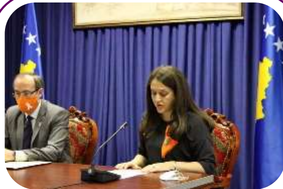
KGSC i premijer Hoti govore na potpisivanju Politike protiv seksualnog uznemiravanja u javnoj upravi na Kosovu u novembru 2020.

25. novembra, u okviru 16 dana aktivizma protiv rodno zasnovanog nasilja, Premijer Republike Kosovo, Avdullah Hoti potpisao je Politiku protiv seksualnog uznemiravanja u javnoj upravi. KGSC, članica MŽK, u saradnji sa Kancelarijom za dobro upravljanje (KDU), pripremio je politiku protiv seksualnog uznemiravanja u javnoj administraciji na Kosovu radi primene Zakona br. 05/L-021 o zaštiti od diskriminacije i Zakon br. 05/L-020 o ravnopravnosti polova. Cilj ove politike je stvaranje radnog okruženja u kojem se sprečava i sankcioniše svaki oblik seksualnog uznemiravanja.