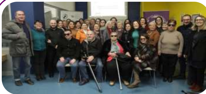
MŽK organizuje orijentacionu sednicu sa 20 MŽK organizacija korisnica u januaru 2020. godine.

Preko Fonda žena Kosova (FŽK), MŽK je dodelila 19 grantova za 20 korisničkih organizacija na Kosovu u iznosu od 59.266 EUR u 2020. Dotacije su podržale Austrijska agencija za razvoj (AAR) (48.410 EUR) i UN Women (10.866 EUR). Grantovi Partnerstva za promene povećala su saradnju omogućavanjem organizacijama u različitim regionima Kosova da udruže snage i zajednički zagovaraju. Na primer, Medica Kosova i Kolevka osmeha pokrenula je inicijativu: „Mobilizacija članica skupštine žena da odgovore na potrebe žena traumatizovanih ratom”.