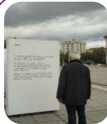
Građanin čita sažetak izložbe u oktobru 2020. godine.

30. oktobra, MŽK je ponovo otvorila izložbu „Prekini tišinu: Završavanje nasilja iza zidova“. Izložba informiše građane o različitim oblicima nasilja, gde mogu da prijave nasilje, kao i detaljne informacije o ulogama i odgovornostima svake institucije. Oko 70