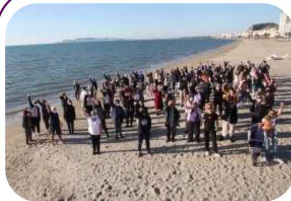
Članice MŽK sarađuju na izradi nacrtu feminističke strategije, Drač, oktobar 2020.

Ove godine, članice MŽK-a su bile dobro informisane o inicijativama, aktivnostima MŽK i mogućnostima finansiranja. Zbog pandemije COVID-19, članice MŽK-a nisu mogle da se lično sastanu. Zato je MŽK održala tri redovna tromesečna sastanka članstva i jedan godišnji sastanak članstva putem Zoom-a, gde je 138 različitih članica, partnera i podržavalaca razmenjivalo informacije i obaveštavani su o tekućim aktivnostima MŽK-a i drugih organizacija članica. Od 2015. godine, ukupno 1,197 žena i muškaraca prisustvovalo je sastancima MŽK-a. Tokom sesija, članice MŽK-a odigrali su važnu ulogu u zajedničkom radu na implementaciji strategije MŽK, raspravljajući o političkim i društvenim zbivanjima na Kosovu i nadgledajući i ocenjuvajući rad MŽK.