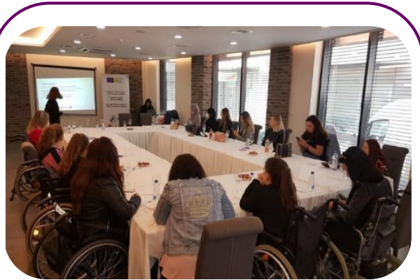
MŽK organizuje radionicu za žene sa invaliditetom u maju 2021.

MŽK je 15. maja vodila radionicu za žene sa invaliditetom u Organizaciji osoba sa mišićnom distrofijom Kosova (OPMDK). Sve učesnice su bile žene sa invaliditetom iz različitih geografskih oblasti Kosova, koje su naučile više o tome kako i zašto da se zalažu za bolje uključivanje rodni pitanja u javne politike i procese pristupanja EU, sa pažnjom i rodnom osetljivošću prema ženama sa invaliditetom. Učesnice su identifikovale potencijalne ciljeve zastupanja na nacionalnom i lokalnom nivou kako bi se dalje zalagale za bolji pravni okvir i