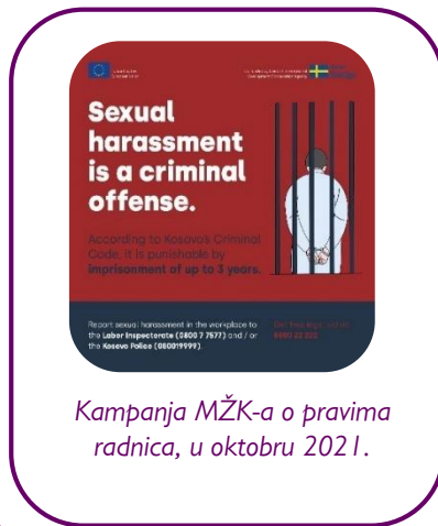
Kampanja MŽK-a o pravima radnica, u oktobru 2021.

Mreža je, u saradnji sa svojim regionalnim partnerima, održala 84 sastanaka za podizanje svesti zainteresovanih strana. Učešćem na raznim panelima, seminarima, konferencijama i radionicama, predstavnici ove koalicije podigli su svest zainteresovanih strana o konceptima diskriminacije i načinima za njeno sprečavanje. Gore pomenuta Koalicija koju koordinira MŽK je pokrenula onlajn kampanju koja obaveštava radnike o seksualnom uznemiravanju na poslu i drugim potencijalnim kršenjima prava, uključujući uslove rada u pandemiji. Kampanja je takođe informisala ljude o besplatnoj pravnoj pomoći ako žele da prijave seksualno uznemiravanje, diskriminaciju zasnovanu na polu i kršenje prava radnica. Mediji na Kosovu su o kampanji izveštavali više od šest puta.