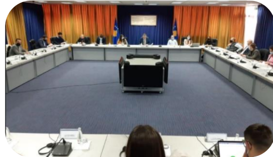
Rad MŽK-a je priznat na sastanku sa civilnim društvom u vezi sa evropskom' agendom o reformi-akcionim planom u novembru

MŽK je nastavila svoju blisku saradnju sa Agencijom za rodnu ravnopravnost (ARR), kao glavnim mehanizmom za rodnu ravnopravnost na Kosovu. MŽK je kontinuirano ažurirala i koordinirala svoj rad sa APRR-om u vezi sa inicijativama koje se odnose na rodnu ravnopravnost u procesu pristupanja EU.