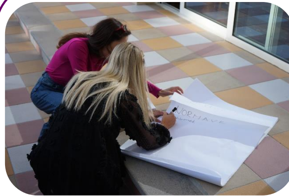
Članice MŽK-a sarađuju na izradi Feminističke strategije u Draču u oktobru 2021. godine.

MŽK je nastavila da informiše svoje članice o inicijativama, aktivnostima MŽK-a i mogućnostima finansiranja. MŽK je održala četiri sastanka članstva, na kojima je 140 različitih članica, partnera i pristalica razmenilo informacije i obavješeno o tekućim aktivnostima MŽK-a i njenim članicama. Od 2015. godine, ukupno 1.335 žena i muškaraca prisustvovalo je sastancima MŽK-a. Tokom ovih sastanaka, članice MŽK-a su igrali važnu ulogu u zajedničkom radu na sprovođenju strategije MŽK-a, raspravljajući o političkim i društvenim dešavanjima na Kosovu, i nadgledajući i ocenjujući rad MŽK-a.