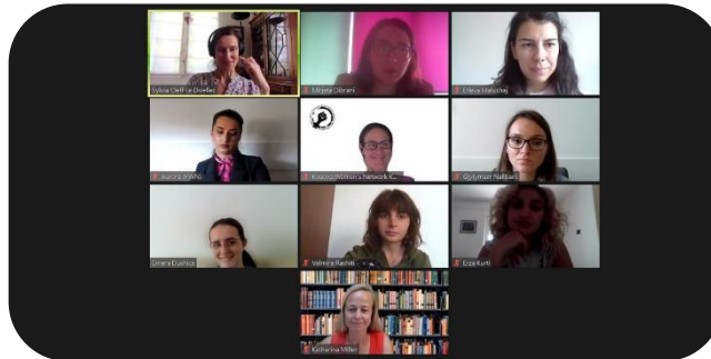
Održavanje treće prateće radionice, EWLA, MŽK Dalja saradnja za ženska prava, jun 2021.

MŽK je nastavila da pruža mogućnosti za svoje osoblje da povećaju svoje kapacitete, uključujući jačanje veština komunikacije među kancelarijama, integrisanje rodne perspektive, digitalnu bezbednost i finansije. Održane su mentorske sesije o zalaganju za EU; sprovođenje rodne analize; pisanje koncept papira; izrada strategija zastupanja; izrada izveštaja; nadgledanje i ocenjivanje; istraživanje; i veštine javnog govora. Dalje, MŽK u partnerstvu sa Evropskim udruženjem pravnica (EWLA) organizovala je dve radionice za članove osoblja na temu „Sudski pravni lekovi pred institucijama EU i telima međunarodnog prava“ i „Prava osoba sa invaliditetom i rod na Kosovu“.