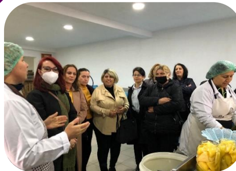
Članica MŽK-a „EULOC“ posećuje kompaniju koju vode žene u Vitini, u okviru inicijative „Promovisanje politike prilagođene porodici“, Novembar 2021

Prošle godine, MŽK je zajedno sa svojim regionalnim partnerima radila na sedam istraživačkih izveštaja o rodno zasnovanoj diskriminaciji i radu u regionu, uključujući po jedan za svaku od šest zemalja ZB-a i jedan regionalni izveštaj. Oni su sadržali konkretne preporuke za institucije da se bolje bave rodno zasnovanom diskriminacijom i biće objavljeni 2022. godine. Ove godine, MŽK je podržala četiri organizacije članice da informišu različite zainteresovane strane na lokalnom nivou o rodno zasnovanoj diskriminaciji prema ženama i da promovišu politike i radna mesta