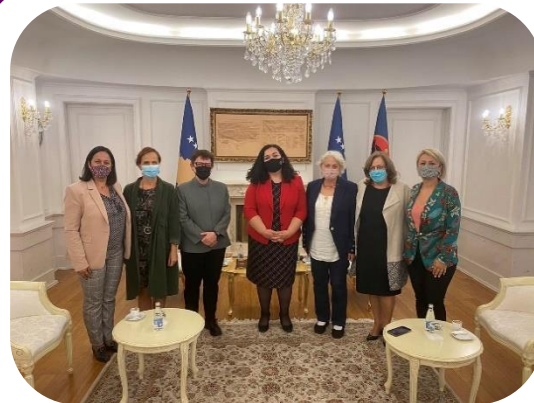
Predstavnice MŽK-a se sastaju sa predsednicom Republike Kosovo Vjosu Osmani u junu 2021. godine

Dana 7. juna 2021. godine, predstavnici MŽK-a posetili su predsednicu Republike Kosovo, Vjosu Osmani-Sadriu, da joj čestitaju na izboru na funkciju i razgovaraju o mogućnostima saradnje za unapređenje rodne ravnopravnosti na Kosovu. Zajedno su razgovarali o usklađivanju Zakona o opštim izborima sa Zakonom o rodnoj ravnopravnosti, daljoj koordinaciji u borbi protiv nasilja i seksualnog uznemiravanja žena i uključivanju žena u dijalog Kosova i Srbije kroz grupu eksperata. Predsednica Osmani je naglasila da je tokom njenog mandata rodna ravnopravnost jedan od njenih prioriteta, uz prava dece sa posebnim potrebama i ekološka pitanja.