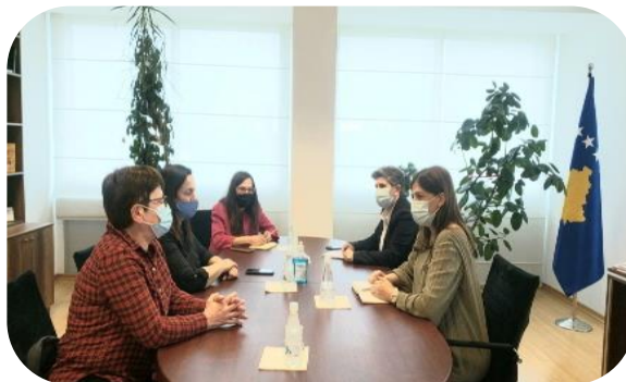
U aprilu, MŽK se sastaje sa ministarkom pravde Hadžijuom koja se zalaže za borbu protiv nasilja nad ženama

Da bi informisala zainteresovane strane o sprovođenju pravnog okvira, i da bi obezbedila pravilnu implementaciju, MŽK je održala sastanke zastupanja sa sledećim relevantnim institucijama: Ministarkom pravde; Zamenikom ministra obrazovanja, nauke, tehnologije i inovacija; Ministarstvom finansija, konkretno direktorom Odeljenja za porodicu i socijalne usluge; šefom Kancelarije za zaštitu i pomoć žrtvama; i različitim OCD, kao što su Kosovski pravni institut i Kallxo.com itd. da se zalažu za poboljšanje odgovora na rodno zasnovano nasilje na Kosovu, da dele i razgovaraju o nalazima i preporukama za svaku instituciju i da razgovaraju o mogućnostima za saradnju u rešavanju pitanja rodno zasnovanog nasilja, kroz pravosuđe, socijalne službe i obrazovanje. Dalje, MŽK je bila prisutna u 250 medijska članka kako bi se raspravljalo o nalazima izveštaja, rodna zasnovanom