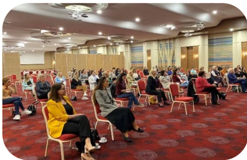
Članovi Lobija i Koalicije održavaju zajednički sastanak u junu 2021.

Dana 7. juna 2021. godine, održan je zajednički sastanak sa članicama MŽK-a, Lobija i Koalicije za ravnopravnost. Oko 70 učesnika razgovaralo je o učešću žena na lokalnim izborima. Razgovaralo se