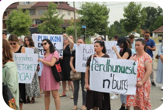
Demonstranti ispred Centra za socijalni rad u Lipljanu, jul 2021

MŽK je 16. jula podigla svoj glas protiv silovanja 13-godišnje devojčice iz Janjeva, zahtevajući pravdu i protestujući ispred Centra za socijalni rad (CSR) u Lipljanu. Brojni građani i