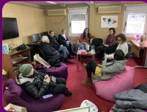
"Radionica koju vodi članica MŽK 'Have Hope' edukuje žene o pravima i kršenjima u oblasti zdravstvene zaštite"

Korisnice su izrazile zahvalnost na podeljenim informacijama i cenile su postojanje platforme na kojoj mogu da izraze svoja iskustva o kršenju prava na zdravstvenu zaštitu. Tokom radionice koju je organizovala NVO Drugeza, jedna učesnica je rekla: „Volela bih da sam znala da možemo nekome da se požalimo na ove okrutne reči koje nam lekari govore“.