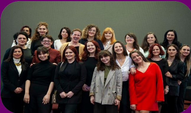
Stafi i RrGK gjatë Kuvendit Vjetor të Anëtareve, dhjetor 2022.

Ky raport paraqet arritjet dhe rezultatet në secilin prej këtyre programeve dhe synimeve ndërthurëse në vitin 2023. Në përgjithësi, RrGK ka zbatuar afërsisht 70% të Strategjisë së saj. Raporti gjithashtu përmban informacione për buxhetin e RrGK-së, mbështetësit, Bordin e Drejtorëve, Bordin Këshillimor, stafin, praktikantët, vullnetarët, anëtarët dhe përfituesit e granteve.