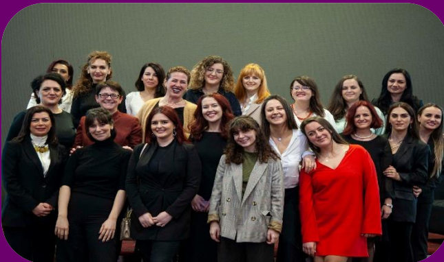
Stafi i RrGK gjatë Kuvendit Vjetor të Anëtareve, dhjetor 2022.

Ky raport paraqet arritjet dhe rezultatet në secilin prej këtyre programeve dhe synimeve ndërthurëse në vitin 2023. Në përgjithësi, RrGK ka zbatuar afërsisht 70% të Strategjisë së saj. Raporti gjithashtu përmban informacione për buxhetin e RrGK-së, mbështetësit, Bordin e Drejtorëve, Bordin Këshillimor, stafin, praktikantët, vullnetarët, anëtarët dhe përfituesit e granteve.