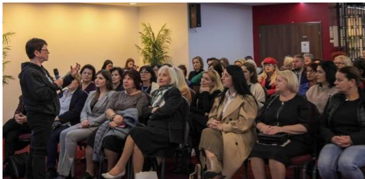
Dana 9. novembra 2024. godine, članice MŽK-a okupile su se da razgovaraju o dostignućima, izazovima i strategijama za jačanje saveza za unapređenje prava i osnaživanje žena