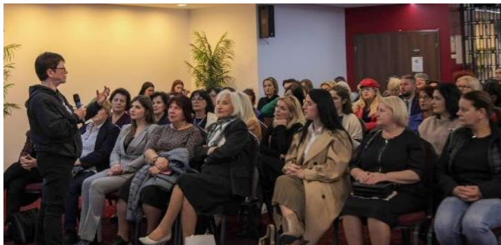
Dana 9. novembra 2024. godine, članice MŽK-a okupile su se da razgovaraju o dostignućima, izazovima i strategijama za jačanje saveza za unapređenje prava i osnaživanje žena