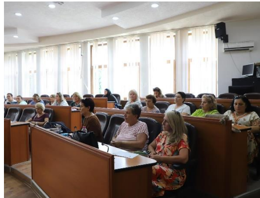
MWAHR angažuje žene na raspravi o budžetu u opštini Mitrovica 2024. godine.

MŽK je nastavila sa zalaganjem za institucionalizaciju rodno odgovornog budžetiranja (GRB) kroz sastanke i pisma zagovaranja i godišnje budžetske preporuke upućene Kancelariji premijera, Ministarstvu finansija, rada i transfera (MFRT), parlamentu i opštinama. MŽK je istakla značaj institucionalizacije GRB-a kroz njegovo uključivanje u pravni okvir za javne finansije, koji je trenutno u procesu izmene. Iako je procenat budžetskih organizacija na opštinskom nivou (89%) i na centralnom nivou (62%) koje podnose aneks GRB-a, koji zahteva MFRT, porastao, mnoge odgovorne institucije to i dalje ne čine. Kvalitet aneksa i dalje nije zadovoljavajući, a oni se retko objavljuju i stavljaju na raspolaganje javnosti, uprkos naporima MŽK za veću transparentnost. MŽK je nastavila sa radom na postizanju sledećih neposrednih rezultata u vezi sa ovim ciljem tokom 2024. godine, uz podršku ADA i Švedske.