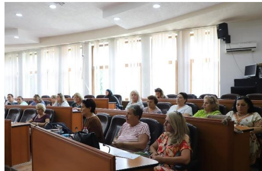
SHMGDNJ angazhon gratë në një dëgjim buxhetor në Komunën e Mitrovicës në vitin 2024

RrGK vazhdoi bashkëpunimin me organizatat anëtare në monitorimin e procesit të Anëtarësimit në BE nga një perspektivë gjinore, veçanërisht me SHMGDNJ dhe Qendrën Kosovare për Studime Gjinore (QKSGJ). RrGK gjithashtu synoi të mbledhë kontributin e OShC-ve të ndryshme për Raportin e Kosovës të Komisionit Evropian për vitin 2023 dhe të angazhojë ato në konsultimet e qeverisë me shoqërinë civile për Agjendën e Reformave Evropiane. Në vitin 2024, katër OShC bashkëpunuan me RrGK në monitorimin e proceseve të Anëtarësimit në BE, duke përfshirë një qasje ndërsektoriale në këtë monitorim. OShC-të e angazhuara përfshinin organizata që mbështesin gratë në zonat rurale, gratë me aftësi të kufizuara, të moshave të ndryshme dhe të përkatësive të ndryshme etnike, duke përfshirë SHMGDNJ, Ecos Women, Qendrën Kosovare për Studime Gjinore dhe Organizatën e Personave me Distrofi Muskulare të Kosovës (OPDMK).